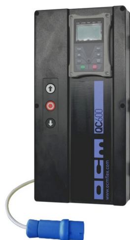
Coffret de commande T600-S