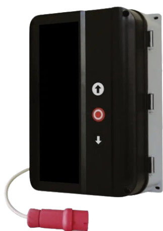
Coffret de commande T500